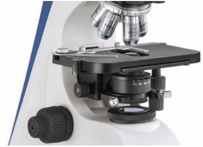
Zentrierbarer Abbe-Kondensor auch mit „Swing-Out“ Linse verfügbar