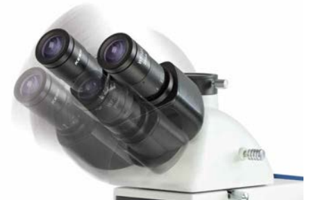
Butterfly-Kopf (optional erhältlich)